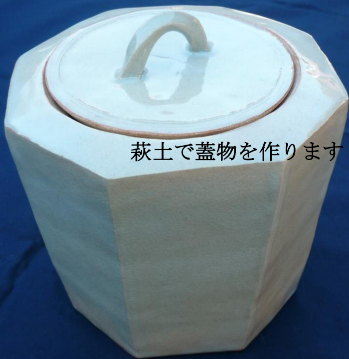
萩土で蓋物を作ります