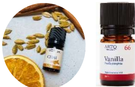
CHAI &amp; バニラ