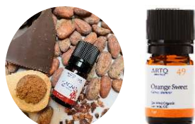
CACAO &amp; オレンジ