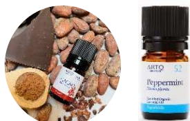
CACAO &amp; ペパーミント