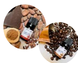
CACAO &amp; COFFEE