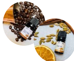
COFFEE &amp; CHAI